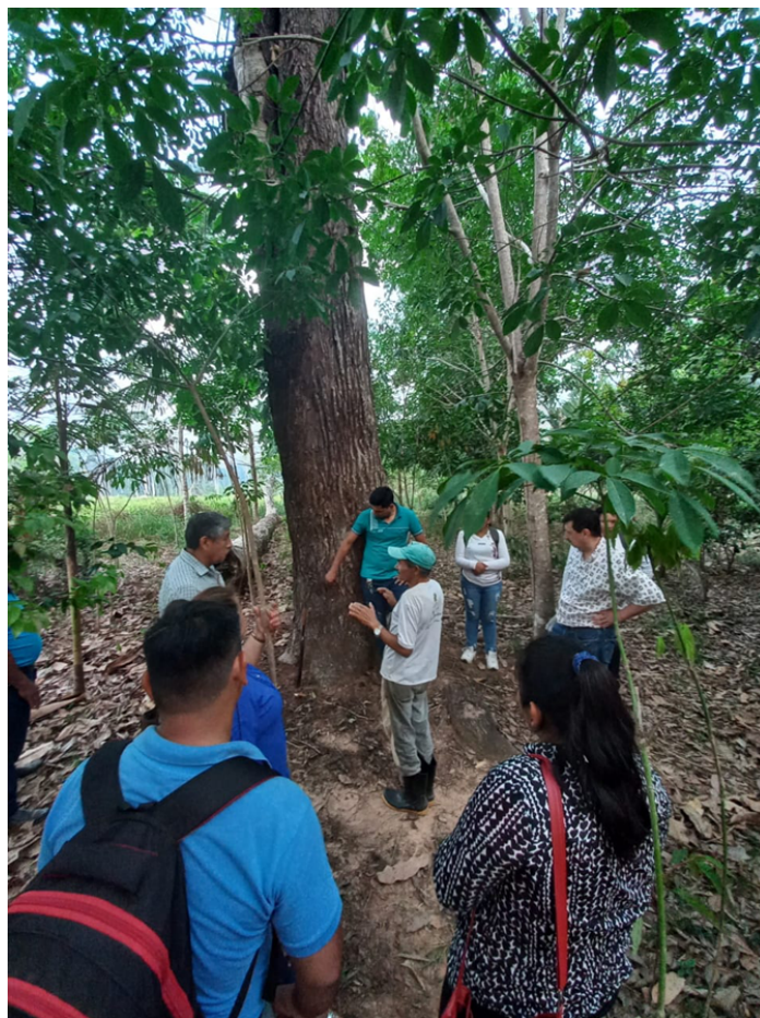
Zelador florestal e produtor agroflorestal na Reserva Extrativista Chico Mendes. 28 de setembro de 2021.