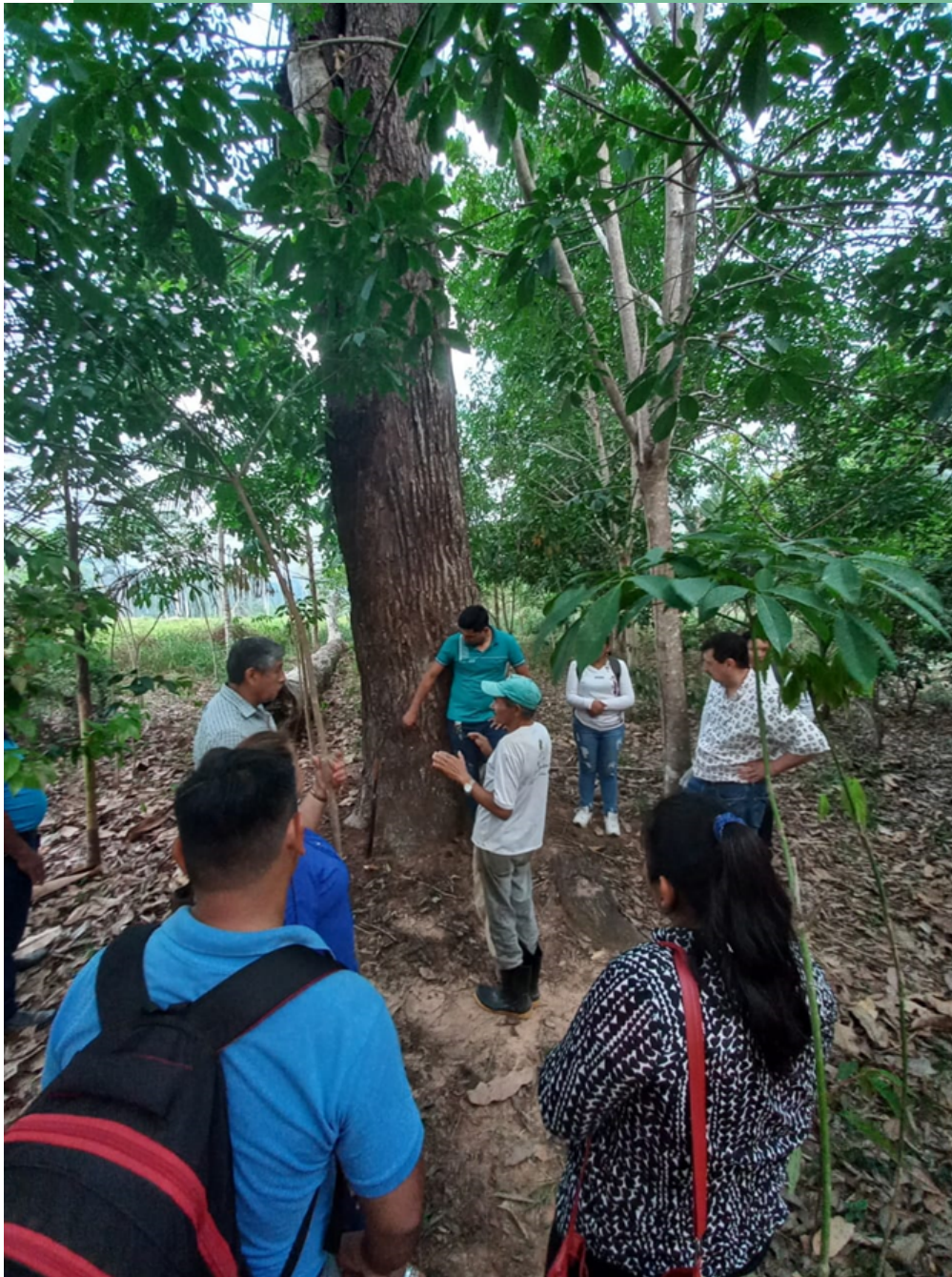
Cuidante de los bosques y productor agroforestal en la Reserva Extractivista Chico Mendes. 28 de septiembre 2021.