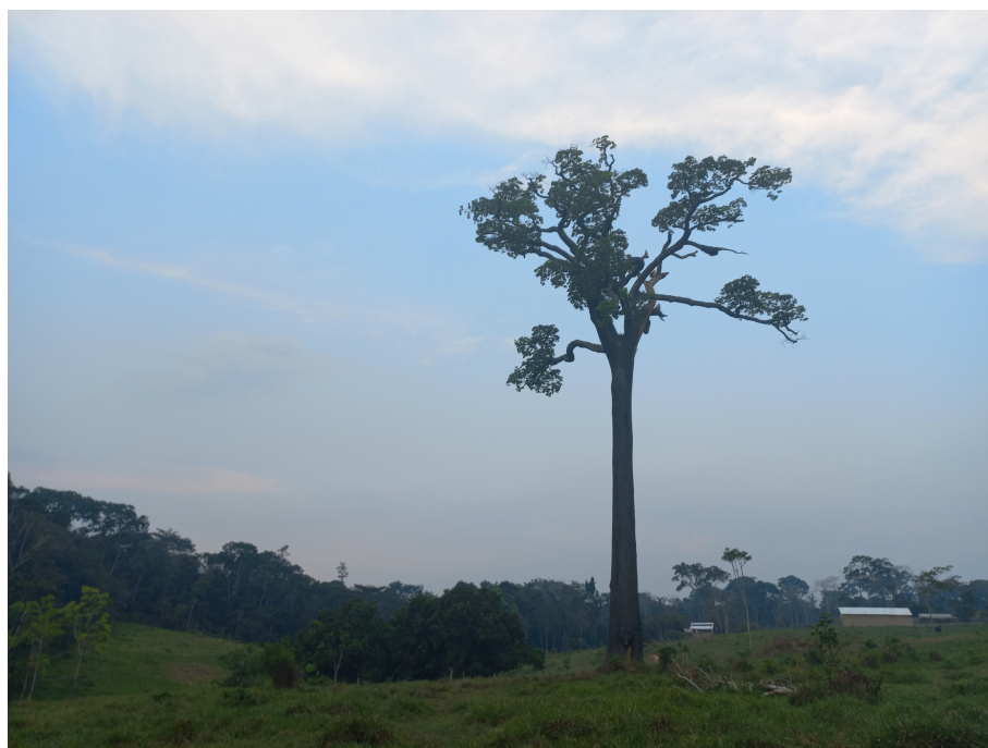
Avance de deforestación, quema y ganadería en la RESEX, 28 septiembre 2021.