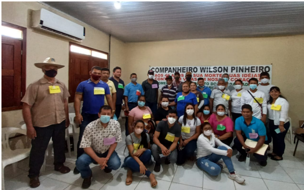
Participantes do encontro, Brasileia 28 de setembro de 2021.

No encontro, foram refletidos diferentes pontos, que são desafios que devem ser assumidos. Em primeiro lugar, foi mencionado que a Reserva Chico Mendes e outros espaços florestais precisam do apoio de todos, e que o individualismo atual e a divisão nas organizações devem ser superados, alcançar uma união para conseguir uma mudança, atenção com políticas públicas que apoiem as pessoas que ali vivem. Mas, eles têm que ser políticas públicas diferenciadas de acordo com o tipo de produtores e habitantes que vivem lá, para que um trabalho deve ser feito a partir das bases para tornar tudo o que está pensando uma realidade. A união é um elemento essencial para unir forças e lutar por dias melhores, mas sobretudo para adquirir direitos, gerar políticas internacionais que possam ajudar a garantir apoio à agricultura familiar, o pequeno extrativista dentro da reserva, a fim de preservar esse território e melhorar a qualidade de vida de todos eles.