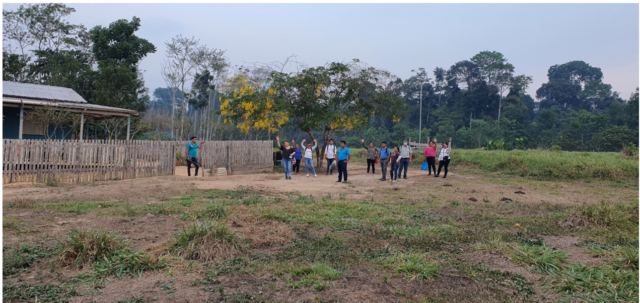
Visita a la Reserva Extractivista Chico Mendes. 28 de septiembre 2021.